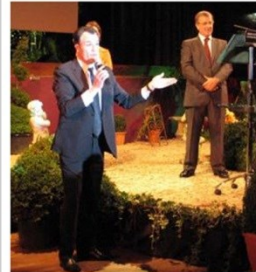
Un étonnant Nicolas Sarkozy, arrivé du fond de la salle, pour donner la réplique au maire... Et pourquoi pas!

jeudi 13.01.2011, 05:16 - La Voix du Nord